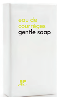
SOAP savon 1.41 oz / 40 g