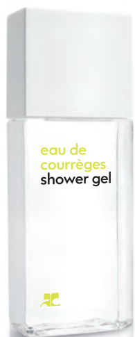
SHOWER GEL gel douche