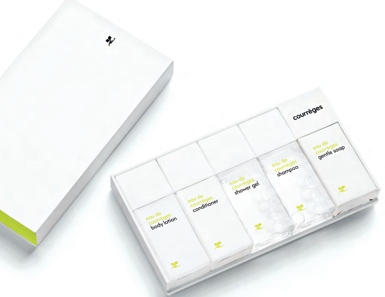
white mat tray 4 bottles - 1 soap / plateau mat blanc 4 flacons - 1 savon