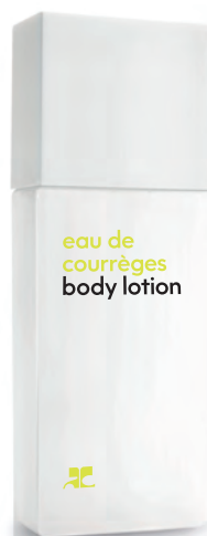
BODY LOTION lait corps